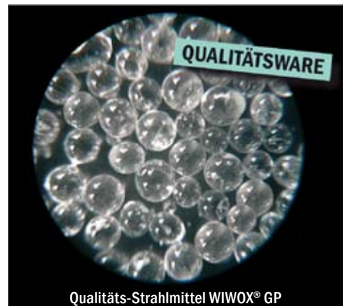
Qualitäts-Strahlmittel WIWOX® GP

Axel Hallensleben / Heike Falk WIWOX GmbH Surface Systems